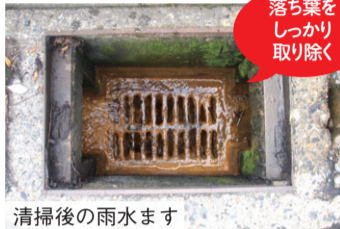
清掃後の雨水ます