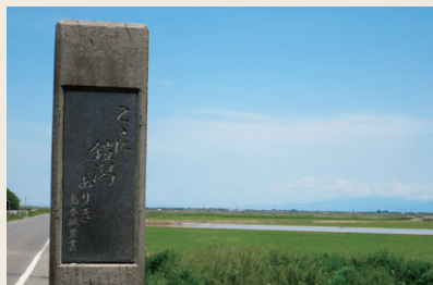
現在の鑑潟干拓地と石碑