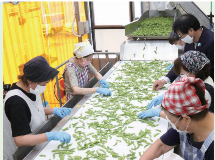
7月10日に中原市長=右上=が同施設を視察。最終選別の手作業を体験