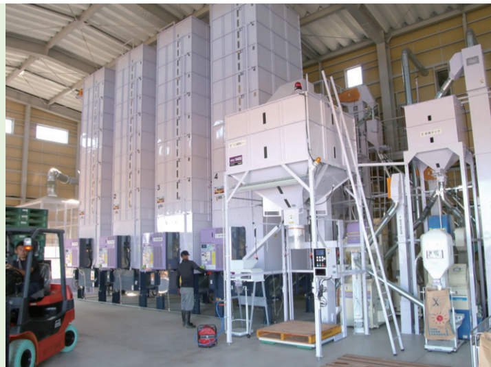
乾燥調製施設内部の様子。搬入から乾燥、包装までが自動化されている