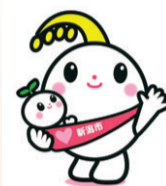
新潟市子育て応援 キャラクター 「ほのわちゃん」