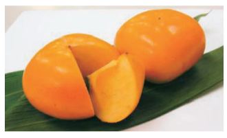
▲西蒲区は県内産の柿の一大産地。越王おけさ柿はしっとりした肉質が特徴