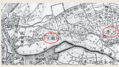
八幡林遺跡出土の木簡 湊足柵の推定地周辺 大正3年版地形図を縮小 『新潟市史』通史編1 原始 古代 中世 近世(上)より