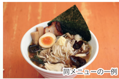
同メニューの一例