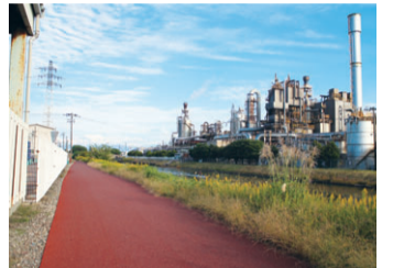
▲お散歩コースの様子。大山ポンプ場脇まで行くと工場が良く見える