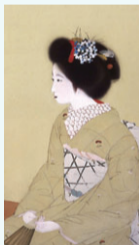
北野恒富「舞妓」(部分) 木原文庫所蔵

ピカソ、新潟ゆかりの作家・末松正樹、佐藤哲三の作品を展示 日12/6(日)まで ¥一般200円、高校・大学生150円 ※企画展観覧券で観覧可。11/7(土)14:00から展示解説を実施