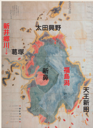
寛政2(1790)年の福島潟の開発状況(「寛政二庚戌年福島潟絵図」北区郷土博物館寄託、個人蔵)