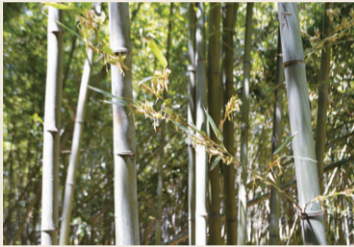
令和元(2019)年、120年ぶりに開花した「逆ダケ」

鳥屋野には元和5(1619)年、東本願寺の命により西方寺が開かれ、親鸞七不思議の巡拝地となりました。