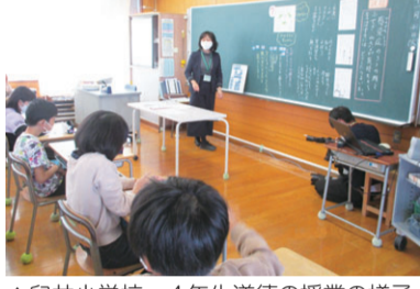
▲臼井小学校 4年生道徳の授業の様子

未来を担う子どもたちには、感染した人やその家族を責めるのではなく、早く治るよう励まし、戻ってきたときに温かく迎えられる人になってほしいと考えています。