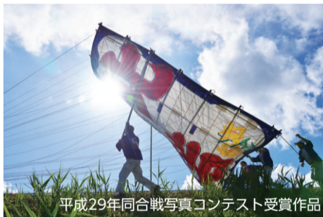
平成29年同合戦写真コンテスト受賞作品