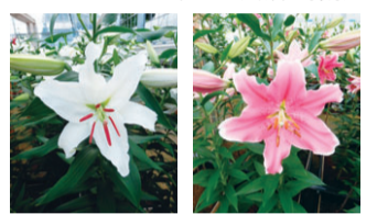
▲シベリア(左)は大輪の花が、ソルボンヌ(右)は鮮やかなピンク色が特徴。コリは1年中出荷されています