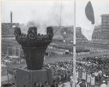
点火された炬火台(新潟国体開会式)