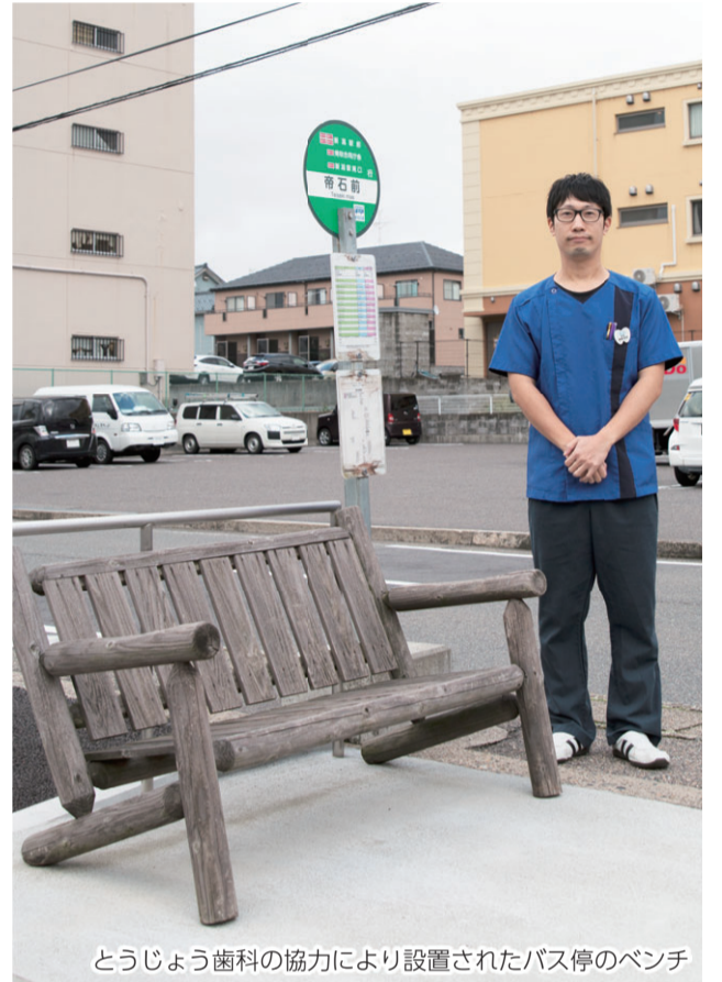
とうじょう歯科の協力により設置されたバス停のベンチ