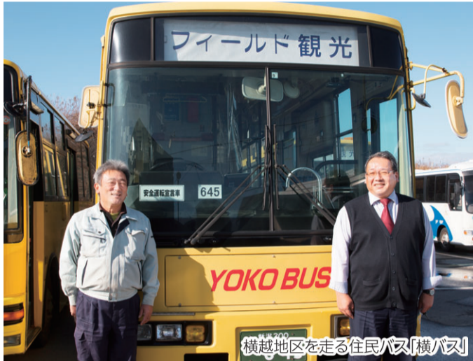
横越地区を走る住民バス「横バス」