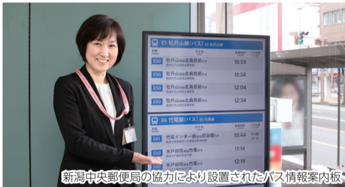
新潟中央郵便局の協力により設置されたバス情報案内板