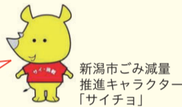
新潟市ごみ減量推進キャラクター「サイチヨ」