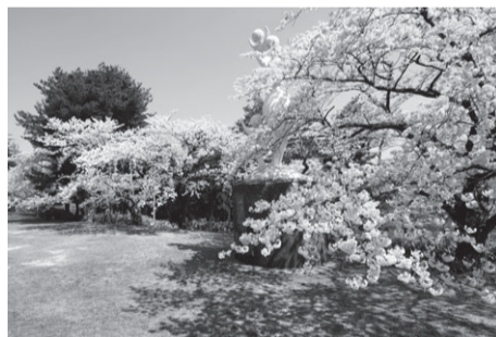
▲秋葉山の展望台からの眺めも格別 秋葉公園(秋葉区秋葉3) 駐200台