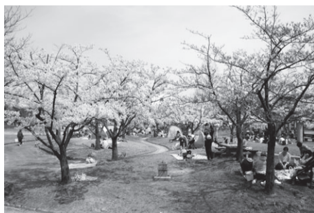
▲遊具の種類が豊富 亀田公園(江南区亀田向陽4) 駐110台