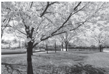
▲広場ではピクニックが楽しめる 濁川公園(北区濁川) 駐約40台