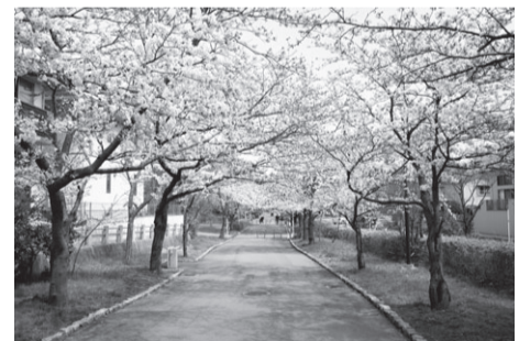
▲チューリップやバラ園でも有名 寺尾中央公園(西区寺尾中央公園) 駐約30台