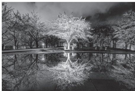
▲夜はライトアップで幻想的な雰囲気 白山公園空中庭園(中央区一番堀通町) 駐212台