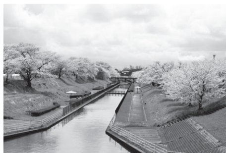
▲4/1~10にライトアップを実施 桜遊歩道公園(南区鷺ノ木新田) 駐なし ※ライトアップは18時~21時半