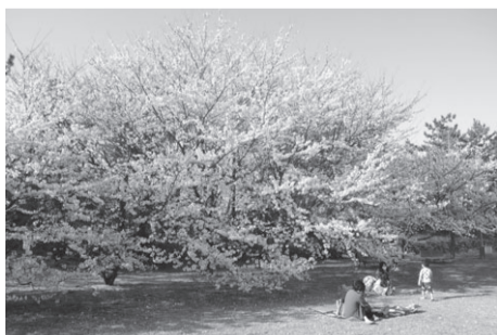
▲飛行機や船舶も見ることができる 山の下海浜公園(東区船江町1) 駐130台