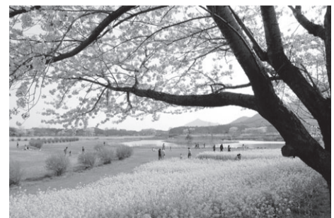
▲角田山と菜の花も美しい 上堰潟公園(西蒲区松野尾) 駐212台

感染症予防対策をしっかりと出掛けてください。体調が悪いときは不要不急の外出をせず、安静にしましょう。