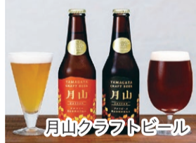
月山クラフトビール