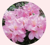
アザレア (市食と花の銘産品)