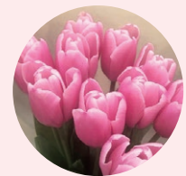
チューリップ (市食と花の銘産品)

花選びに迷ったときは、お店の人に相談してみましょう。 店舗や時期により欠品している場合があります。