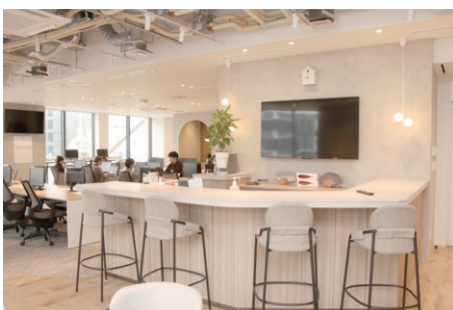
▲オフィスは開放感があり、暖色系の明かりで落ち着いた感じられる