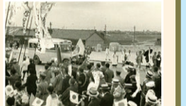
▲出征兵士を見送る行列とすれ違うバス

戦時の物資統制で、ガソリンやバスの部品は手に入りにくくなり、代替燃料への転換や運行数の減少を余儀なくされました。出征で男性の働き手が少なくなったため、運転士など、それまで男性が担っていた業務に女性が就くことになりました。銀色だったバスの車体は空襲の標的にならないよう国防色のカーキ色に塗られ、夜はヘッドランプに覆いが掛けられました。