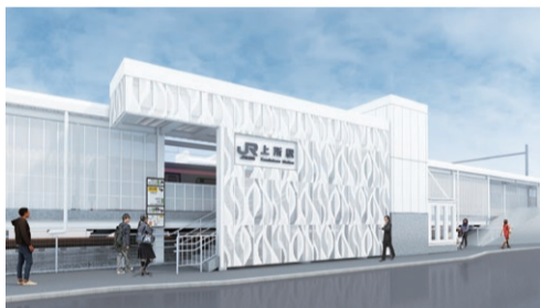
▲上所駅(南口)完成イメージ

●ホーム 2面2線 ●形態 無人駅 ※簡易Suica改札機、乗車駅証明発行機を設置。北口、南口に駐輪場、南口にロータリーを整備。北口前の道路は、夏ごろまで車両通行止め。詳しくは現地の通行規制看板で案内 問 都市交通政策課 (☎025-226-2730)