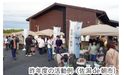
昨年度の活動例(佐潟de朝市)

●補助対象期間 9月30日(火)までに実施する活動 ●補助率 2分の1(上限50万円) ※25万円までは全額補助 ●申し込み 3月31日(月)までに所定の申請書をメール(kansei@city.niigata.lg.jp)で環境政策課へ ※申請書など詳しくは新潟市ホームページに掲載