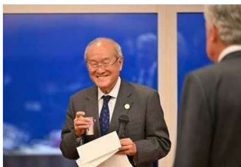
酒器（知事記念品）を乾杯に使用 ※

会議の記憶や新潟での思い出を心に留めてもらうため、参加国・機関の代表者らに記念品を贈呈しました。記念品はホテル客室に設置する形で贈呈しましたが、一部の記念品は同じものが日本政府主催夕食会において、乾杯の酒器や食器として使用されました。