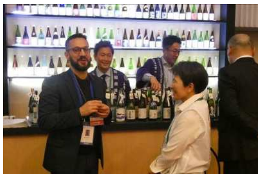
日本酒バーでは県内蔵元の地酒を提供