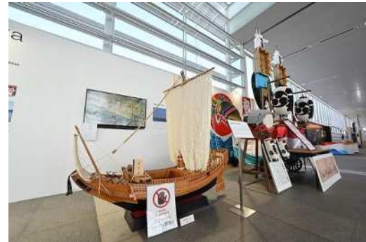
「みなとまち新潟」として北前船や 住吉祭の纏などを展示 ※