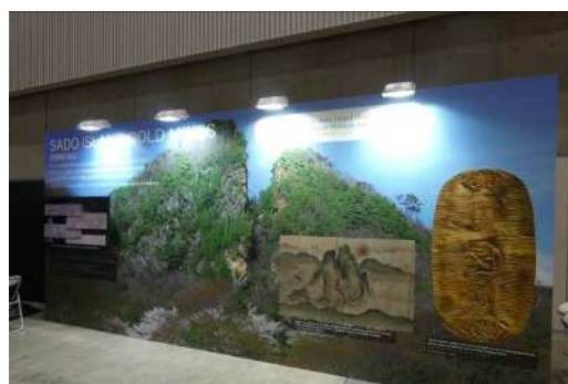
プレス向けに佐渡金山や新潟の四季の魅力紹介展示を設置