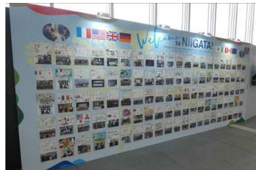
県内55校の小中学生が作成した歓迎カードを展示