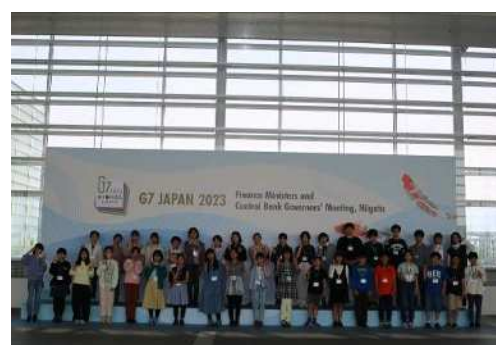
ファミリーフォトを体験