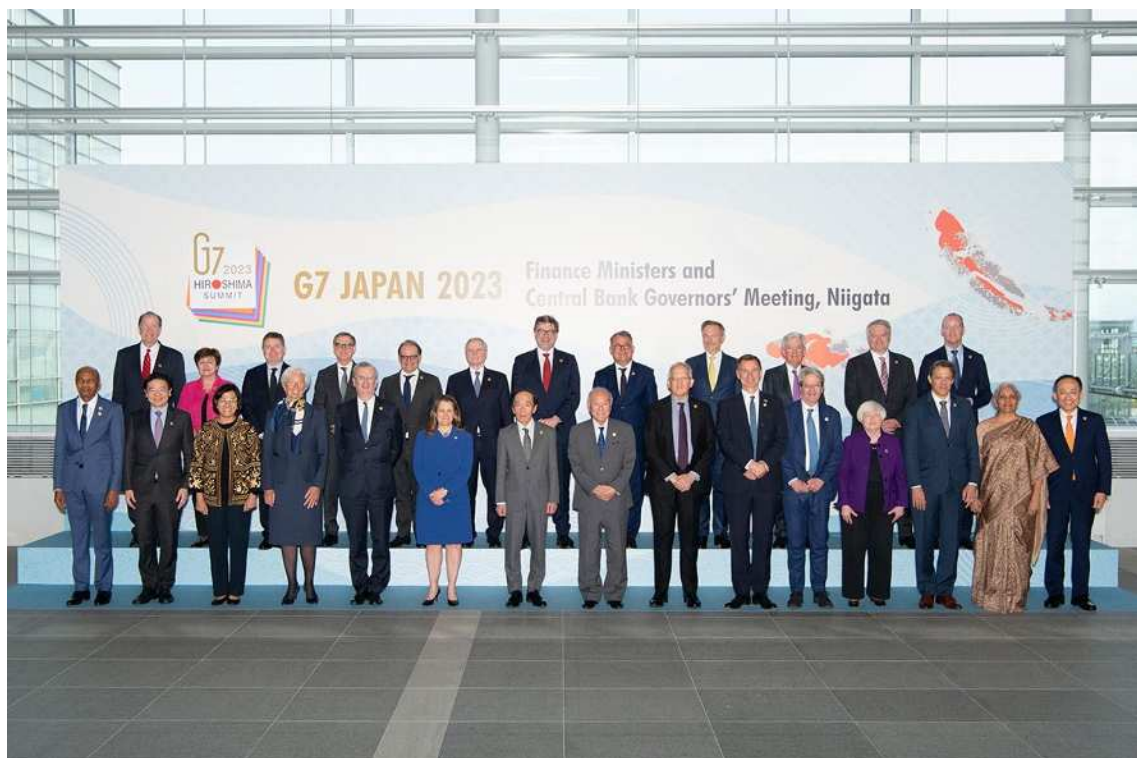
朱鷺メッセにおける集合写真