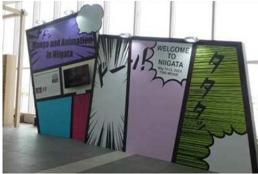
マンガ・アニメ紹介ブースではフォトスポットも設置