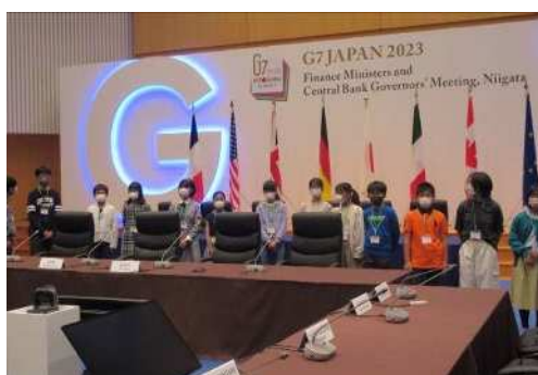
本会議場（4F マリンホール）を見学

市内在住の小中高生37人が会議終了後の会場見学ツアーに参加し、本会議場や会場展示などの見学、参加国・機関の代表者と同じ場所でのファミリーフォト（集合写真）体験を行いました。