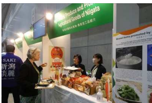
米菓のほか、ル レクチエ ジュースの試飲も