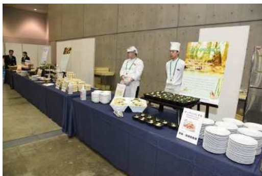
運営スタッフが温かい食事を提供 ※

* 県産コシヒカリ、県産新之助、田上産たけのこ、越後姫、県産もち豚、新発田産アスパラガス、ふのり蕎麦、新潟たれカツ丼、イタリアン、魚沼きりざい、笹団子、柏崎サバサンド、のっぺ ほか