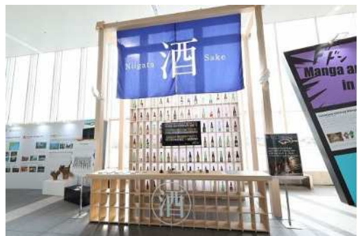
新潟清酒をディスプレイしてPR ※