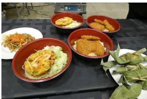
提供メニュー（ふのり蕎麦、たれカツ丼ほか）