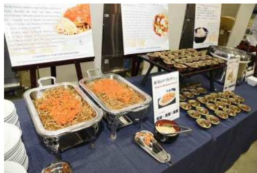
提供メニュー（イタリアン、魚沼きりざい） ※