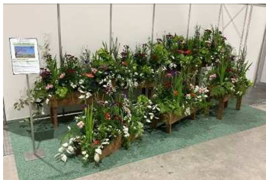
各国の花で平和を表現した装花