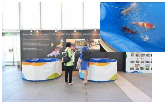
錦鯉の実物展示に見入る会議関係者 ※