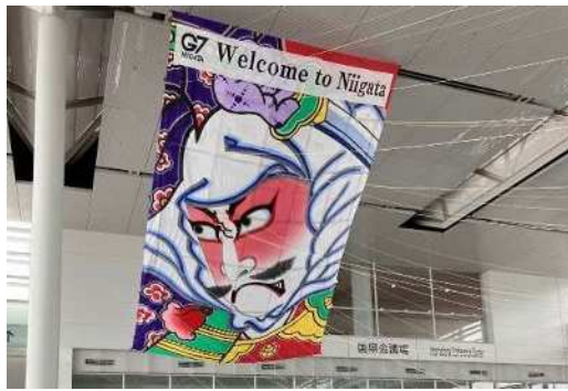
会場アトリウムに24畳の白根大凧を展示し、 会議関係者をお迎え