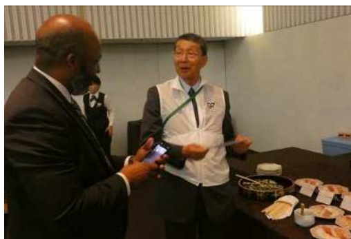
ボランティアから料理の説明を聞く参加者