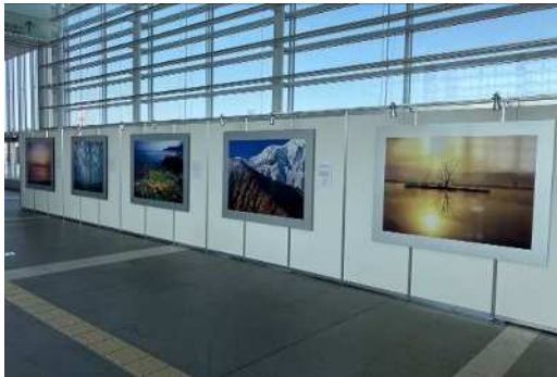
天野尚氏による新潟の美しい風景写真

(天野尚氏の写真、観光情報、佐渡世界遺産登録、みなとまち新潟、錦鯉、ウェルカムカード、県・市基本情報、清酒、マンガ・アニメ、産業、白根大凧、ウェルカムボード、アザレア・チューリップほか)