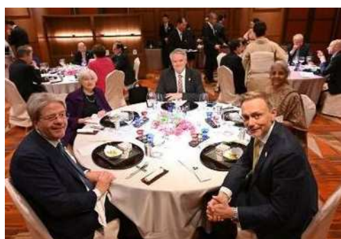
新潟漆器（市長記念品）で食事を提供 ※