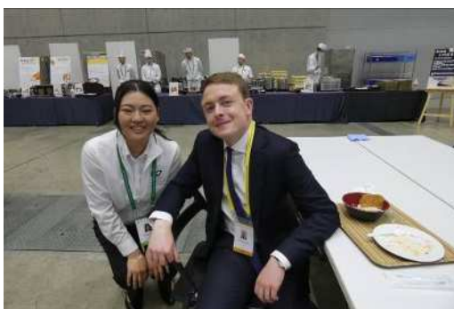
食事を堪能する海外プレス