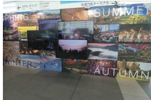
4つのモニターで新潟の四季の魅力を紹介