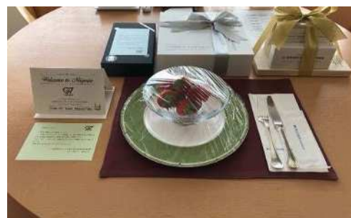
客室への設置の様子

G7各国・機関の代表者が宿泊するホテル客室に、小中学生が作成した歓迎カードを設置するとともに、越後姫と地酒でお迎えしました。