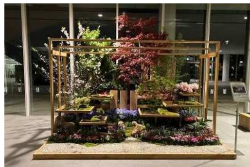
会場エントランス内を和をテーマに装花