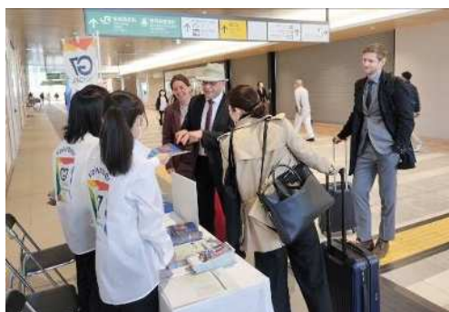
新潟駅での案内の様子

10代~70代まで合計82人のボランティアがプレスセンターやレセプションのほか、新潟駅・新潟空港・ホテルに設置したインフォメーションデスクなど、様々な場所で会議関係者をおもてなししました。