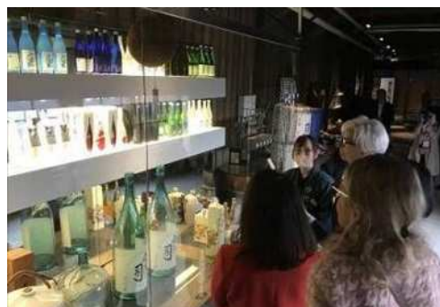
地酒の説明を受けるラガルド欧州中銀総裁一行