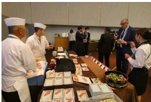
ライブキッチンではシェフが直接料理を提供