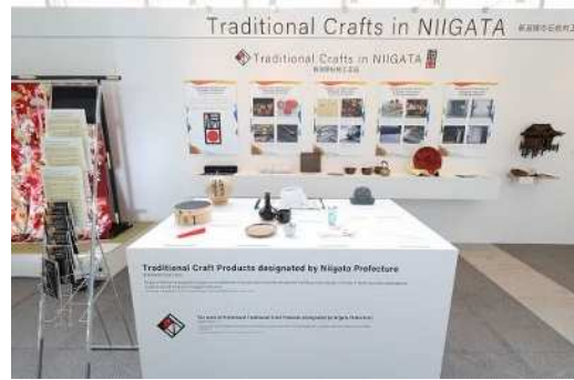
県伝統工芸品などを展示 ※