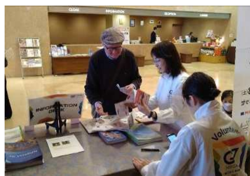
プレス等宿泊ホテルでの案内の様子