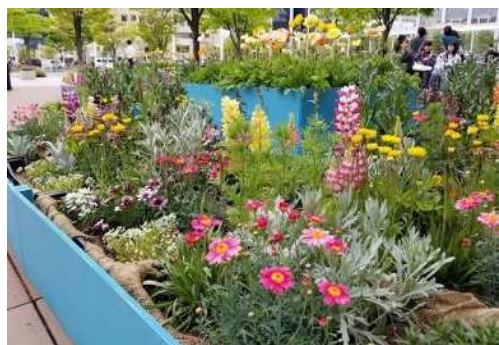
G7ステーションガーデン（新潟駅南口）

新潟駅周辺で植栽やフラワーハンギングを実施したほか、新潟駅や新潟空港を色とりどりの花で飾り、代表団を花でお迎えしました。