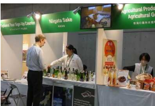
ボランティアが好みを聞きながら地酒を提供