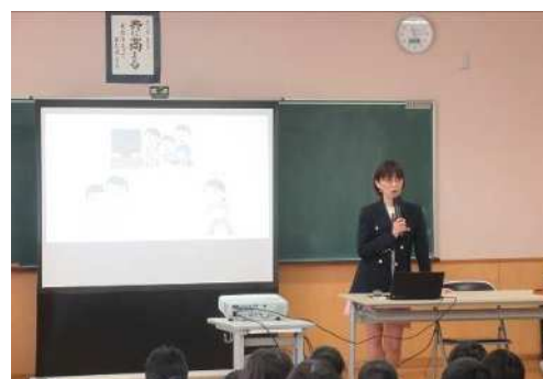
県金融広報アドバイザーによる授業 （荻川小学校）

子どもたちにG7各国への関心・興味を高めてもらうとともに、財政・金融の知識を身につけ、財政を自分たちに関わる問題として捉えてもらうため、新潟財務事務所等と連携し、小中学校等で財政・金融をテーマとした授業を実施しました。