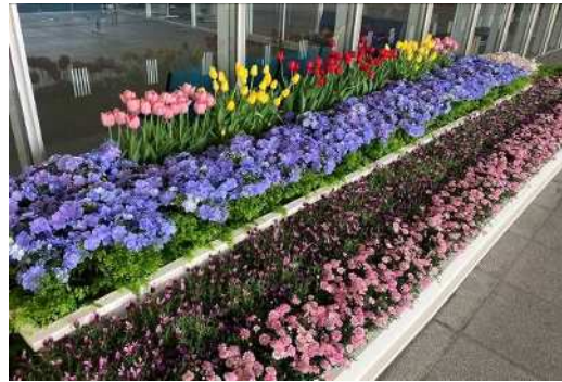
エントランス前を県・市の花である チューリップ等で装花