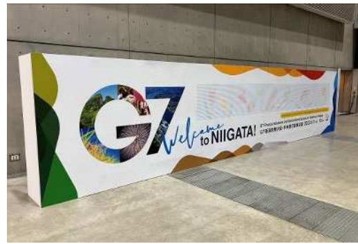
県民から募集したメッセージによる モザイクアートを使用したウェルカムボード