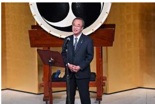
花角知事による歓迎のあいさつ ※