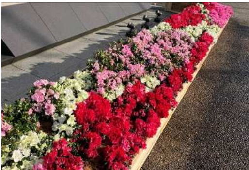
会場入口広場をアザレアで装花