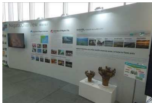
県・市基本情報とあわせて火焰土器等を紹介