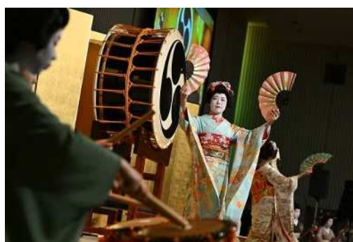
新潟古町芸妓による演舞の披露 ※