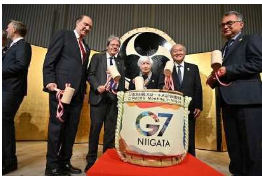
地酒を使用した鏡開き ※