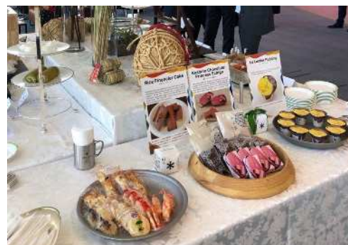
お米のフィナンシェや越後姫のショコラ などを提供 ※

会議の合間に地元特産品を使ったスイーツや飲み物を提供し、会議関係者へのおもてなしと新潟製品のPRを行いました。