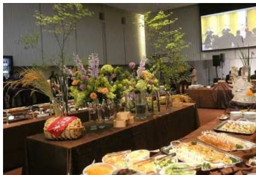
新潟の食材をふんだんに使用したメニューを提供