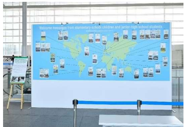
県内37の小中学校生徒が作成したウェルカムメッセージを 1枚のボードに配置し会場に展示