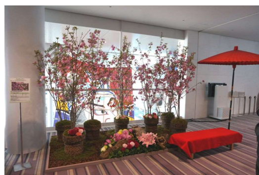
会場内の装花により和を演出