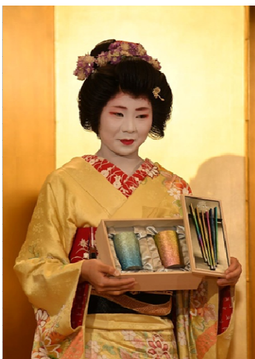
花角知事贈呈記念品 純チタン製2重タンブラー 「窯創り」2個セット 純チタン製ストロー兼マドラー 「Straler」6本セット