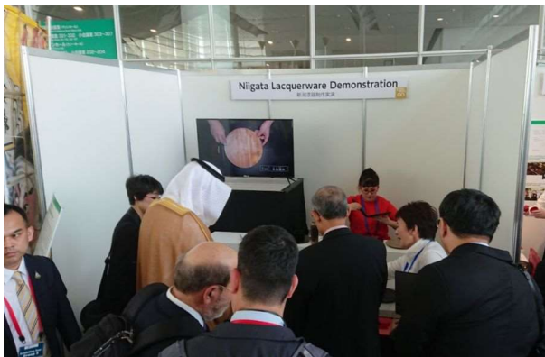
新潟漆器の実演を視察する会合参加者