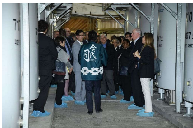
今代司酒造(株)で説明を受けながら酒蔵内を見学する参加国・国際機関の代表ら