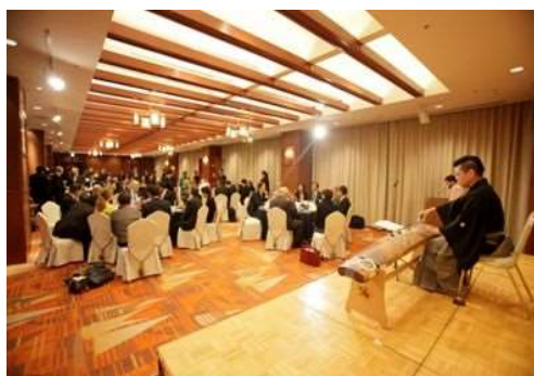
邦楽器による和の演出