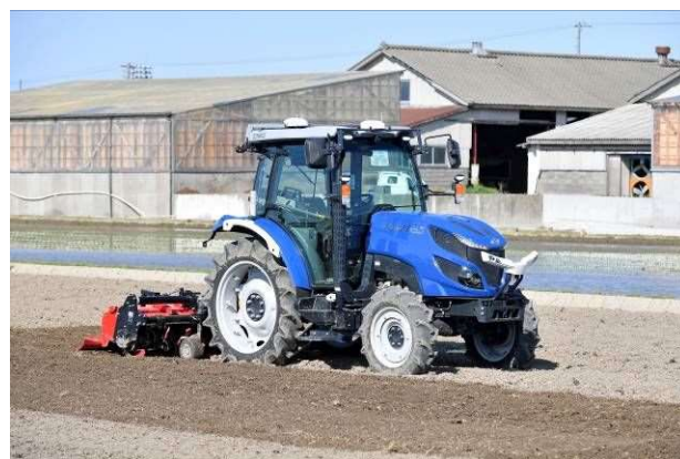
自動運転トラクターの実演