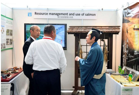
鮭の資源管理について説明を聞く会合参加者