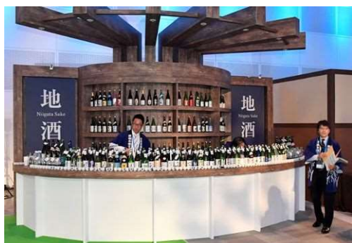
日本酒バーでは県内88の酒蔵の地酒を提供