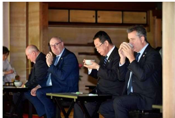
呈茶を体験する各国大臣ら