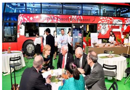
レストランバスのテラス席で歓談する参加者