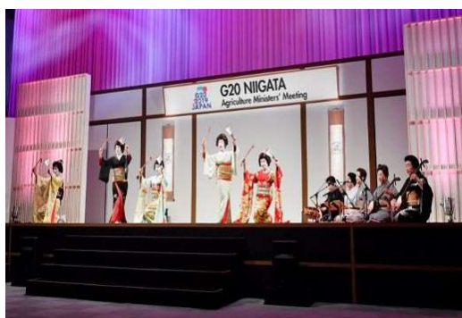
新潟古町芸妓による演舞の披露