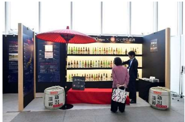
新潟清酒紹介ブースを設置し新潟清酒をPR