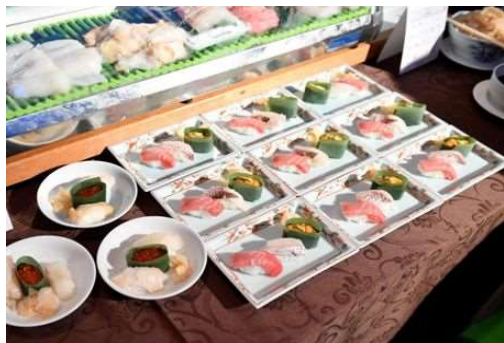
地元新潟の食材をふんだんに使った料理などを提供