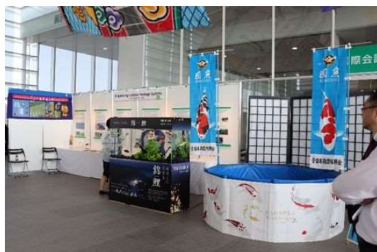
錦鯉(実物)と県内の農業に関する遺産(世界農業遺産、世界かんがい施設遺産、日本農業遺産)を紹介