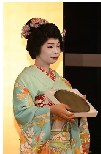
中原市長贈呈記念品 新潟漆器 「朧銀塗・丸平皿」2枚組