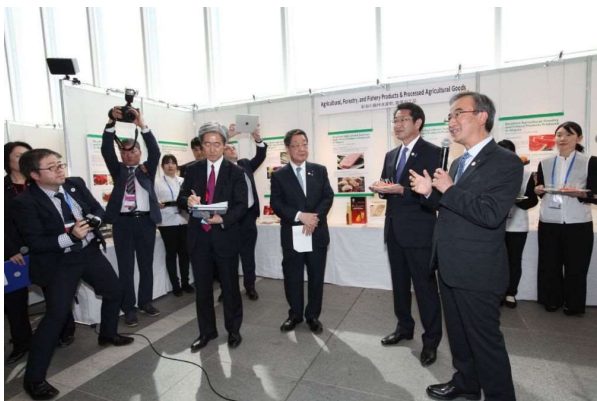
新潟の豊かな食を紹介する花角知事と中原市長