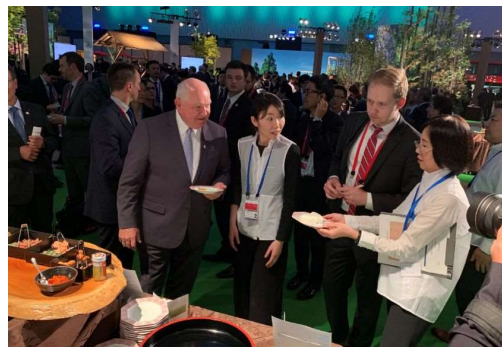
新潟米おにぎりの説明を受ける参加者