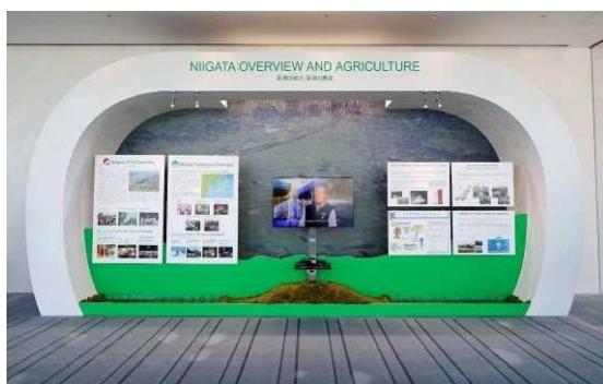
縣市概要ブースでは水田やウォーターサインを設置