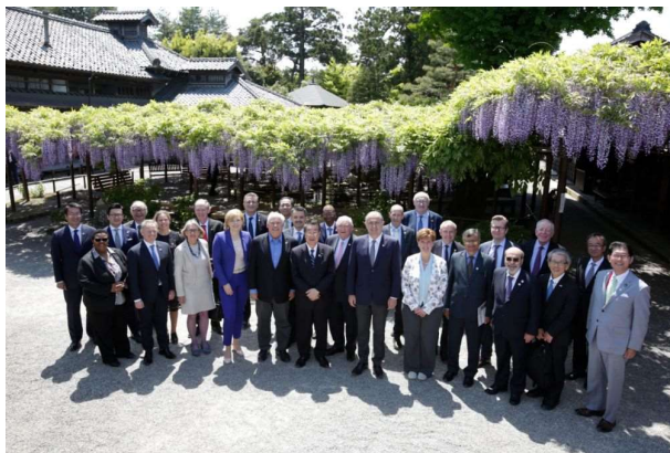
北方文化博物館 満開の藤棚の前で記念撮影を行う参加国・国際機関代表