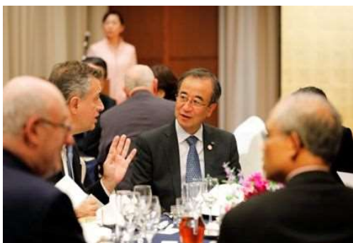
各国代表らと歓談する花角知事