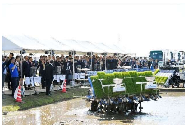
(有)米八 自動運転田植え機の実演を見学する参加国・国際機関の代表ら