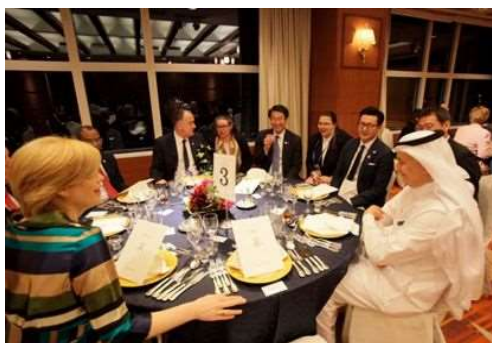
各国代表らと歓談する中原市長