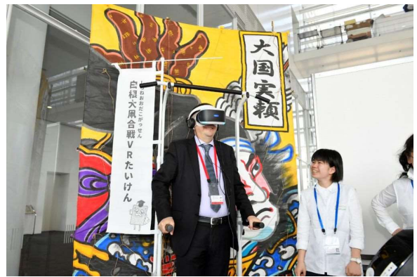
大風合戦のVR体験を楽しむ会合参加者