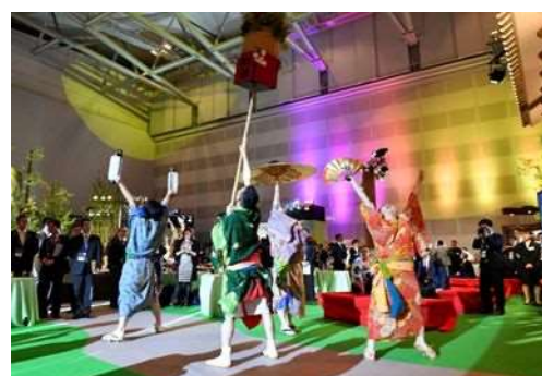
会場全体を沸かせた新潟総踊り