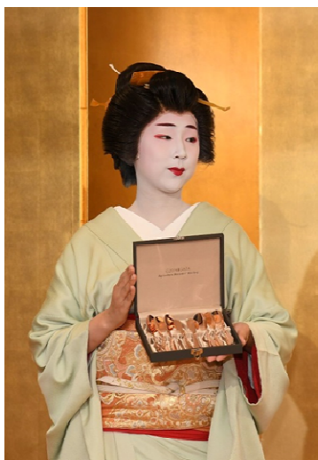
吉川大臣贈呈記念品 純銅製アイスクリームスプーン、 バターナイフのカトラリーセット