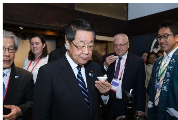
同酒造で造られた日本酒を試飲する吉川大臣ら