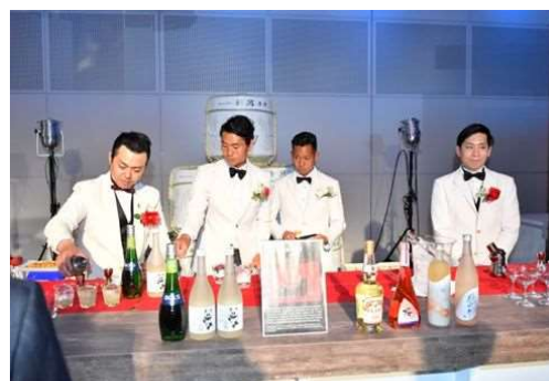
バーテンダーが新潟の地酒を使ったカクテルを提供