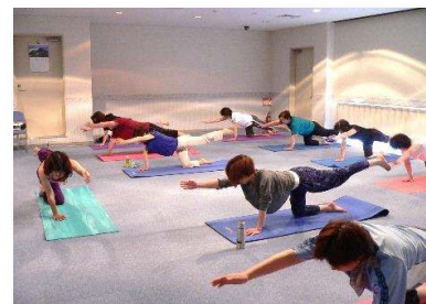
多様な健康教室の実施