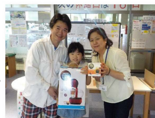
父の日ガラポン大会