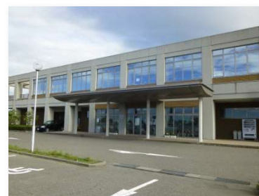
長く市民に親しまれる施設であるために