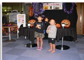
ハロウィンイベント