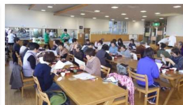
健康食を食べよう(構成団体他施設)