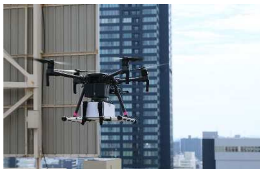
ドローンデリバリーの様子