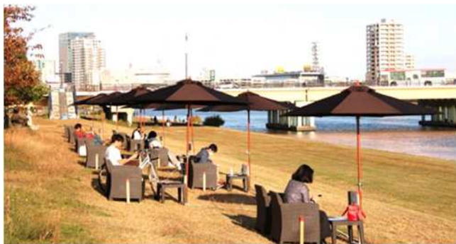
昨年の様子（りゅーとびあ付近）

広報活動にご協力くださいますようお願いいたします。なお、10月22日は現地に取材対応を行いますので、取材を希望される方は、取材申込用紙をご利用ください。