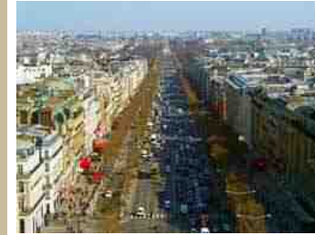
シャンゼリゼ大通り(パリ)…約2km