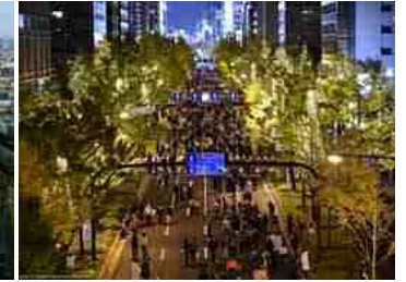
御堂筋(大阪市)…約4km ※写真はイルミネーションイベント